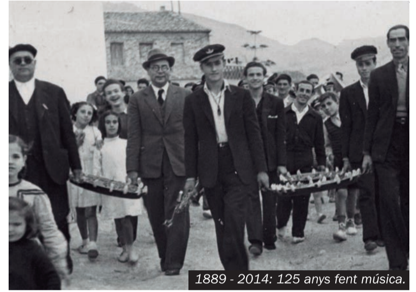
1889 - 2014: 125 anys fent música.