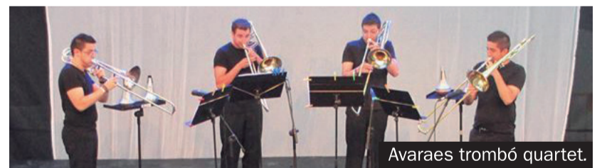
Avaraes trombó quartet.

El objetivo se consiguió con creces. El público se deleitó con las actuaciones y nuestros músicos tuvieron la oportunidad, siempre grata, de ofrecer a los asistentes lo mejor de sus interpretaciones.