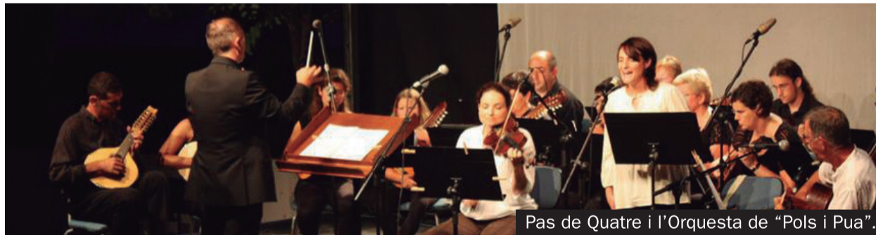
Pas de Quatre i l'Orquesta de "Pols i Pua".